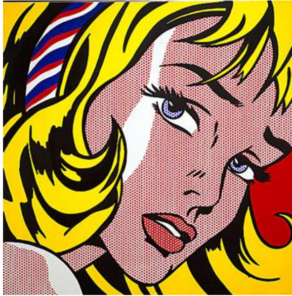
ภาพที่ 1.10 ผลงานศิลปะแนวป๊อปอาร์ต โดย Roy Lichtenstein ที่มา ( http://www.aaronartprints.org )