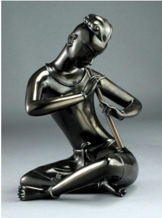
ภาพที่ 1.2 ผลงานประติมากรรม ในประเภทศิลปะแบบวิจิตรศิลป์ "เสียงขลุ่ยทิพย์" พ.ศ. 2494 ศิลปิน เขียน ยิ้มศิริ เทคนิค บรอนซ์ ขนาด 36 x 56 ซม.