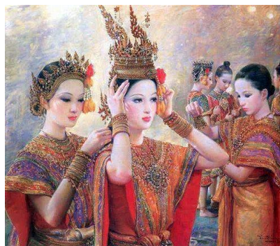
ภาพที่ 1.1 ผลงานจิตรกรรม ในประเภทศิลปะแบบวิจิตรศิลป์ จิตรกรรมประเพณีจากวรรณคดีไทย ของ อาจารย์ จักรพันธุ์ โปษยกฤต ศิลปินแห่งชาติ พ.ศ. 2543

1.1 วิจิตรศิลป์ (Fine art) ได้แก่ งานจิตรกรรม ประติมากรรม ภาพพิมพ์ สถาปัตยกรรม เป็นศิลปะที่สร้างขึ้นเพื่อให้ความรู้สึกทางสุนทรียภาพ ให้อารมณ์สะเทือนใจ ปลุกความเห็นแก่ ให้ประสบการณ์ใหม่หรือให้ความประเทืองปัญญาแก่ผู้ดู