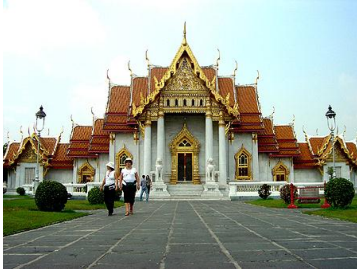
ภาพที่ 1.4 ผลงานสถาปัตยกรรม ในประเภทศิลปะแบบวิจิตรศิลป์

พระอุโบสถวัดเบญจมบพิตร สถาปัตยกรรมที่สมบูรณ์แบบของศิลปะไทย