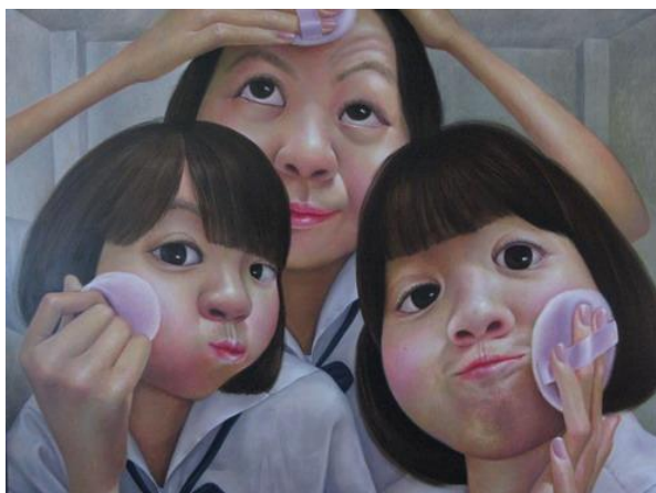
ภาพที่ 1.9 ผลงานศิลปะที่แสดงโครงสร้างด้านรูปทรงและเนื้อหา ซึ่งให้อารมณ์ที่ควบคู่กันไป

ดังนั้นในงานแบบรูปธรรมจะมีเนื้อหาทั้งภายในและภายนอก ซึ่งให้อารมณ์ทั้งทางศิลปะและอารมณ์อื่นๆควบคู่กันไป แต่ในงานแบบนามธรรมจะมีเนื้อหาภายในเพียงอย่างเดียว โดยให้อารมณ์ทางศิลปะที่บริสุทธิ์ ซึ่งในงานศิลปะที่ดีทั้งเรื่อง แนวเรื่อง และรูปทรงจะต้องประกอบเข้าด้วยกันอย่างมีเอกภาพเสมอ