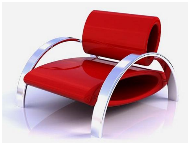
ภาพที่ 1.5 ผลงานออกแบบเก้าอี้นั่ง ในประเภทศิลปะแบบประยุกต์ศิลป์

1.2 ประยุกต์ศิลป์ (Applied art) เป็นศิลปะที่สร้างขึ้นเพื่อใช้ประโยชน์อย่างอื่น นอกเหนือจากความชื่นชมในคุณค่าของศิลปะโดยตรง เช่น ภาพหรือลวดลายที่ใช้ตกแต่งอาคารหรือ เครื่องเรือน รูปทรง สีเส้นของผลิตภัณฑ์อุตสาหกรรมที่ออกแบบให้เป็นที่พอใจของผู้บริโภค หรือ เครื่องใช้ไม้สอยที่ทำขึ้นด้วยฝีมือประณีต ศิลปะที่ประยุกต์เข้าไปในสิ่งที่ใช้ประโยชน์เหล่านี้ จะให้ความพอใจอันเกิดจากความประณีต สวยงาม ความกลมกลืนแก่ประสาทสัมผัส ควบคู่ไปกับประโยชน์ใช้สอย