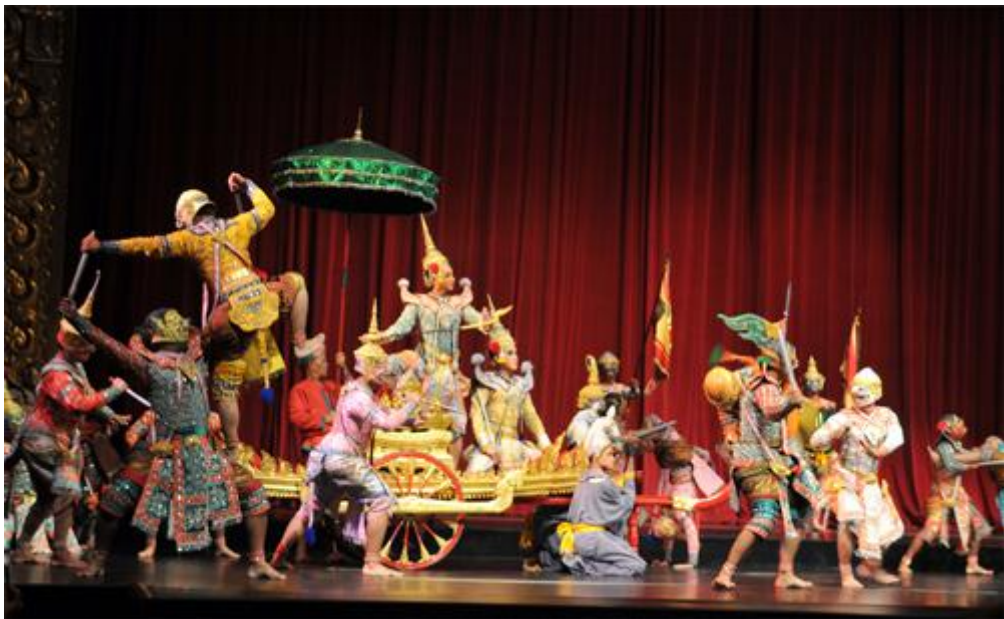
ภาพที่ 1.7 การแสดงโขน นาฏกรรม ในประเภทศิลปะโสตทัศนศิลป์

3.3 โสตทัศนศิลป์ (Audio visual art) เป็นศิลปะที่รับสัมผัสด้วยการฟังและการมองเห็นพร้อมกัน ได้แก่ นาฏกรรม การแสดง ภาพยนตร์ ซึ่งเป็นการผสมกันของวรรณกรรม ดนตรี และทัศนศิลป์ บางแห่งเรียกศิลปะสาขานี้ว่าศิลปะผสม (Mixed art)