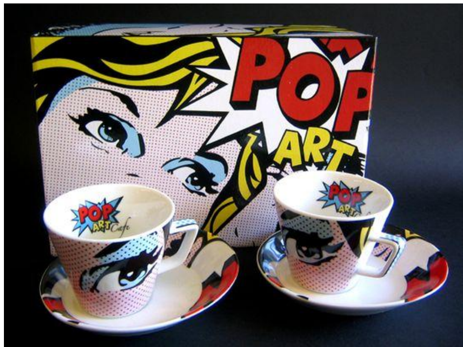
ภาพที่ 1.11 ผลงานการออกแบบ ที่ได้รับอิทธิพลมาจากงานศิลปะแนวป๊อปอาร์ต