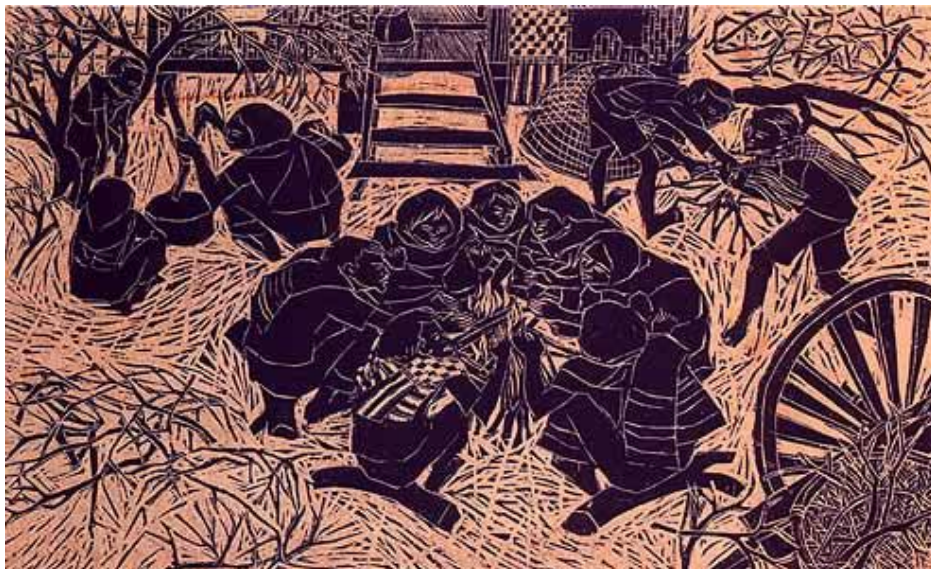
ภาพที่ 1.3 ผลงานภาพพิมพ์ ในประเภทศิลปะแบบวิจิตรศิลป์ ผลงานภาพพิมพ์แกะไม้ “ Around the Fire ” ของ ประพันธ์ ศรีสุตา ขนาด 32.5 x 50 cm. พ.ศ. 2505