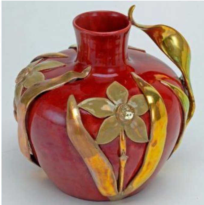
ภาพที่ 1.6 ผลงานออกแบบแจกัน ในประเภทศิลปะแบบประยุคศิลป์