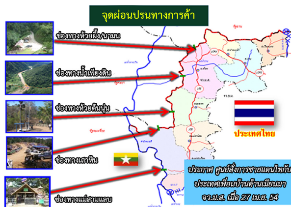
ภาพที่ 3 จุดผ่อนปรนของจังหวัดแม่ฮ่องสอน

นอกจากนี้การเข้า-ออกระหว่างประเทศ จะมีหน่วยงานทหารของทั้งสองประเทศตรวจสอบ ประวัตินักและลงบันทึกเวลาการเข้า-ออก และมีกำหนดเวลาการกลับไว้เป็นหลักฐานทุกครั้ง ซึ่งจุดผ่อนปรนบางแห่งหากได้รับการพัฒนาให้เป็น เขตเศรษฐกิจการค้าชายแดนมีโอกาสเปลี่ยน เป็นจุดผ่อนปรนถาวรเหมือนด่านแม่สาย และ ด่านแม่สอดได้ เช่น จุดผ่อนปรนห้วยผึ้ง อำเภอเมือง และจุดผ่อนปรนห้วยต้นนุ่น อำเภอขุนยวม