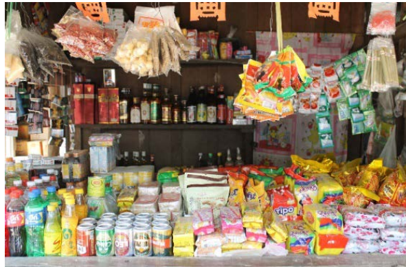
ภาพที่ 3 สินค้าอุปโภค – บริโภค ที่ขายในฝั่งเมียนมา

ส่วนสินค้านำเข้ามายังประเทศไทยเป็นสินค้าเกษตร เช่น โค กระบือ ถั่ว งา พริกแห้ง ติบูก เนื่องจากค่าแรงเมียนมาถูกกว่าค่าแรงไทย