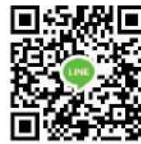
อ.ปางมะผ้า