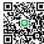
อ.แม่สะเรียง