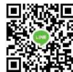
อ.แม่ลาน้อย