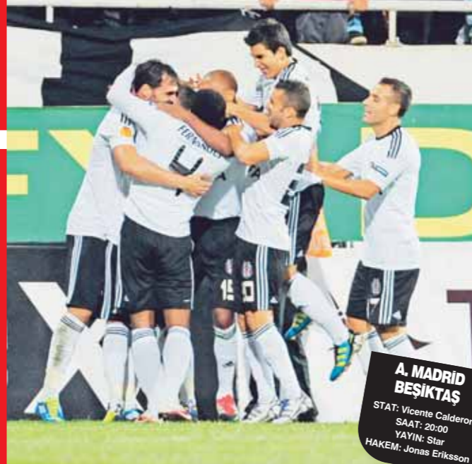
A. MADRID BEŞİKTAŞ STAT: Vicente Calderon SAAT: 20.00 YAYIN: Star HAKEM: Jonas Eriksson

Yıllarca İspanya'da futbol oynayan ve yaşamını İspanya'da sürdüren Beşiktaş'ın eski futbolcularından Nihat Kahveci Best FM'e Atletico Madrid maçı ile ilgili açıklamalarda bulundu. Siyah-Beyazlı takımın bu sene Avrupa'da başarılı bir grafik çizdiğini söyleyen Nihat, "Beşiktaş bu sene Avrupa sahnesinde iyi oynayan, kendinden emin, kendine güvenen bir takım görüntüsü çizdi. Tabii ki son içeride oynadığı Braga maçını çıkartırsak, deplasmanda en önemli şey gol atmaktır. Beşiktaş'ın gol atması gerekiyor. Beşiktaş kendi istediği gibi oynarsa bu turu geçeceğinden eminim" şeklinde konuştu.