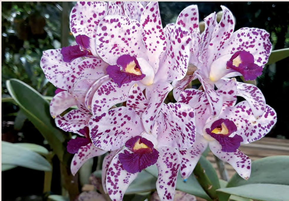
43 Cattleya amethystoglossa présentation du type et de ses variétés