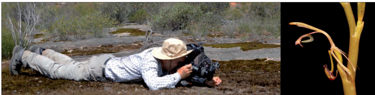
Spiculaea ciliata , John Forrest National Park, Western Australia, 12 octobre 2019. En prélude au numéro spécial de juin dédié à l'Océanie.