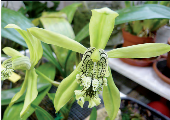
31 Des orchidées faciles à vivre