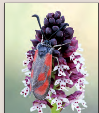
Photographie de première de couverture :

Zygaena sp. sur Neotinea ustulata (Lapanouse de Cernon, mai 2019). (Photo C. RAJADEL).