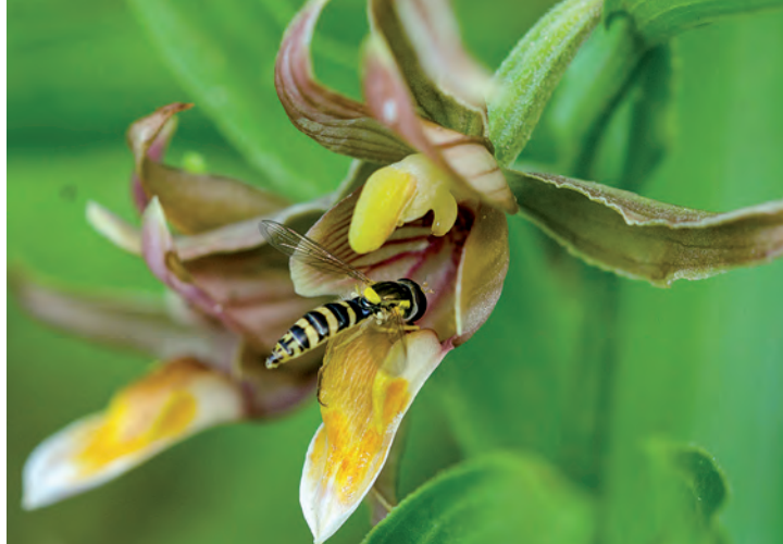
15 Epipactis gigantea au jardin