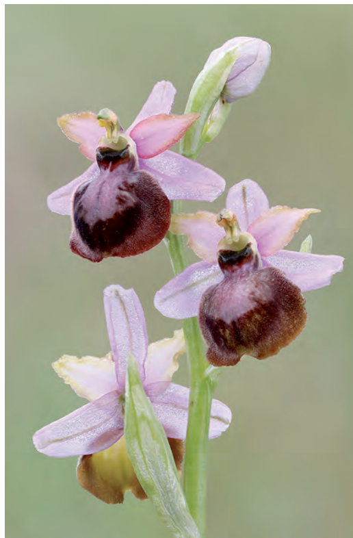
Fig. 1. – Ophrys aveyronensis (Lapanouse-de-Cernon, mai 2017).

Keywords. – Macrophotography, Focus stacking, Aveyron, Larzac.