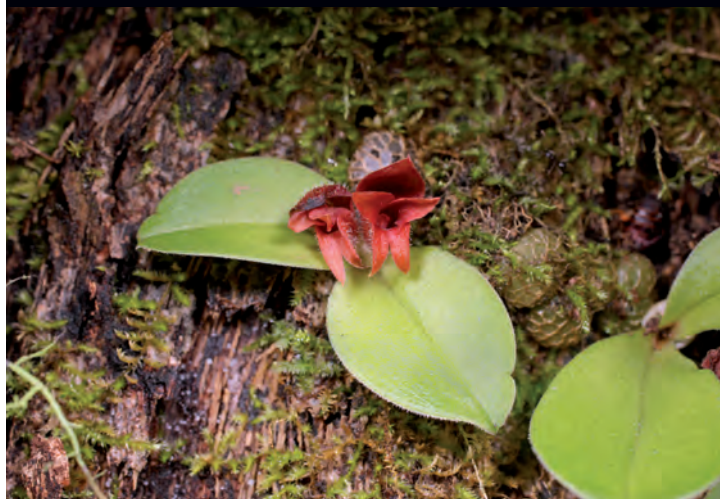
61 Une nouvelle espèce pour le Myanmar