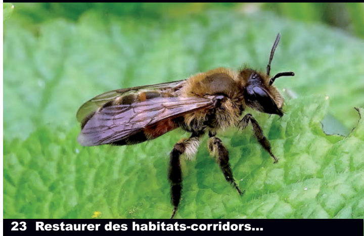
23 Restaurer des habitats-corridders...