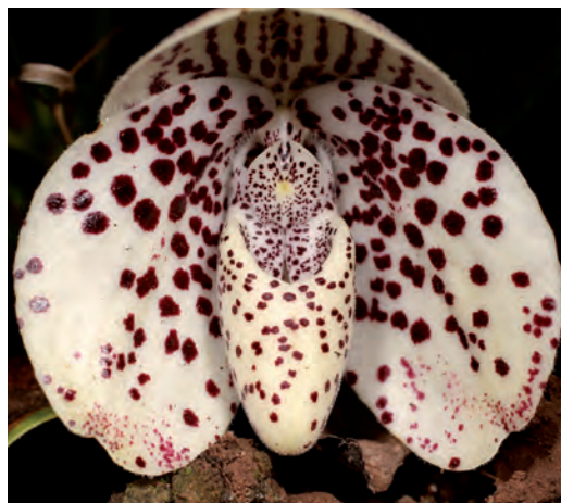
Fig. 1. – Paphiopedilum bellatulum . Aungpan, 25 juillet 2019.

C'est lors d'une randonnée menant à une pagode, près du village de Yengan à l'altitude de 1 300 m, que Lydie CHASSAN a repéré une grande orchidée en fin de floraison sur un rocher. Nous étions passés sans la voir et étions déjà occupés plus loin par le curieux Porpax ustulata (Parish & Rchb.f.) Rolfe (Fig. 2). Sur place impossible d'aller au-delà de « Habenaria sp. ». De retour en France nous avons envoyé des photos de quelques espèces non identifiées ou incertaines à notre ami Hubert KURZWEIL, qui avait guidé la SFO en novembre 1997 en Afrique du Sud et qui travaille depuis au