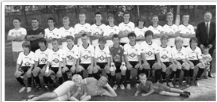
Młodzież, to przyszłość GKS Widawia

Piłkarze nie przespał zimy. Od połowy stycznia mają treningi w hali widawskiej szkoły, biegają po terenie. Co weekend toczą mecze towarzyskie. Wynajmują sztuczne boiska w Zduńskiej Woli czy Sieradzu. Do połowy lutego zagraли 4 spotkania kontrolne. W połowie marca czeka ich ciężki mecz otwarcia. Zmierzą się z bardzo silnym Buczkim.