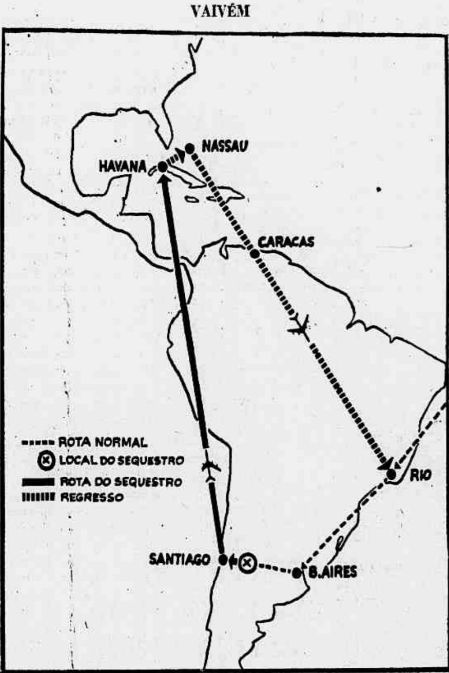
Esta é a rota cumprida pelo PP-VJX antes, durante e depois do seqüestro