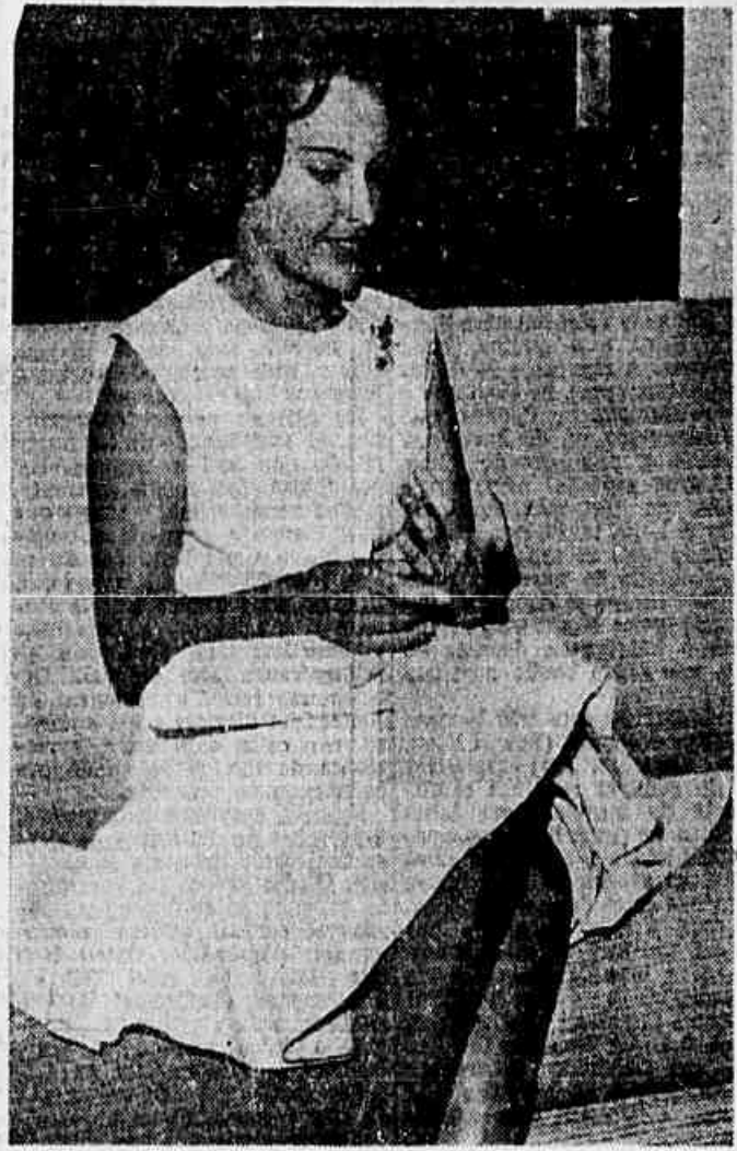
PRIMEIRA DAMA NO JÚRI