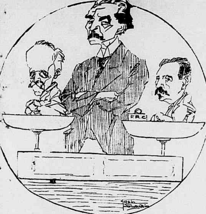
O Sr. Pinheiro Machado - Meu Deus, esta bala está enferrujada... Sempre marca o mesmo peso!... Mas vou arrumar-lhe o P. R. C. (peso real conservador) e verá que lhe estragarei a ferrugem!...