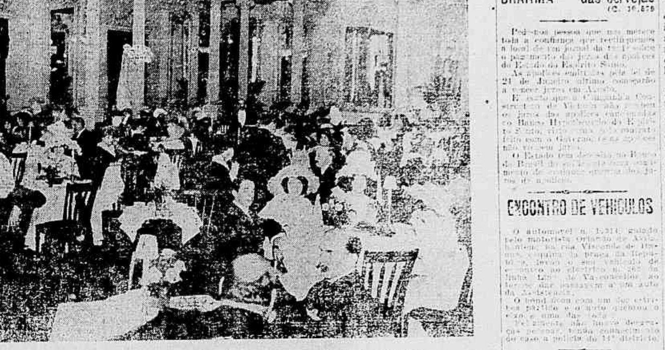
Um dos aspectos do «five-o'clock-tea», realizado hontem no Club dos Diarios

Um dos aspectos do «five-o'clock-tea», realizado hontem no Club dos Diarios. O salão estava cheio de pessoas, e a atmosfera era agradável.