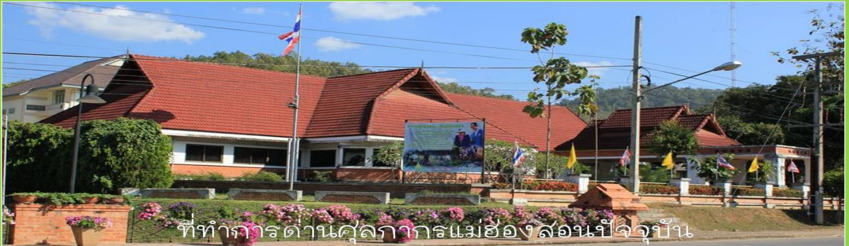
ที่ทำการด่านศุลกากรแม่ฮ่องสอนปัจจุบัน

เมื่อวันที่ ๒๘ พฤศจิกายน ๒๕๔๐ ได้สร้างและเปิดที่ทำการด่านศุลกากรแม่ฮ่องสอนชั้นใหม่เป็นอาคารคอนกรีตชั้นเดียว ตั้งอยู่เลขที่ ๑ ถนนชุมชนประพาสชอย ๔ ตำบลจองคำ อำเภอเมือง จังหวัดแม่ฮ่องสอน